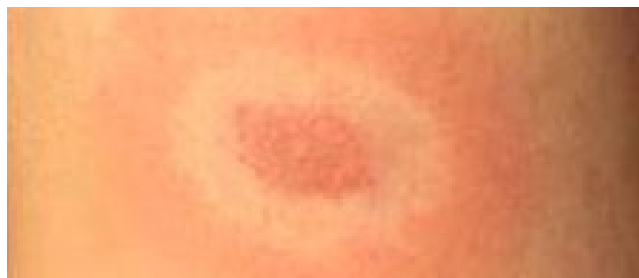
typická skvrna na kůži (erythema migrans)

Asi u 50 % nakažených se objeví typická skvrna na kůži - erythema migrans. Nemusí vypadat typicky jako šířící se kruh se světlým středem, ale může být i celoplošná, od pěti do několika desítek cm. Důležité je, že se objeví s odstupem několika dnů až týdnů (vzácně i měsíců) od přisátí klíštěte, což ji odlišuje od alergie na kousnutí. Její objevení v místě zákusu klíštěte nebo na jiném místě na těle je vždy důvodem k OKAMŽITÉ LÉČBĚ - znamená totiž, že infekce se šíří kůží a postupuje dál do těla. Krev se v této fázi neodebírá, protilátky se ještě nevytvořily a testováním je lze zjistit až asi tři týdny po nakažení.